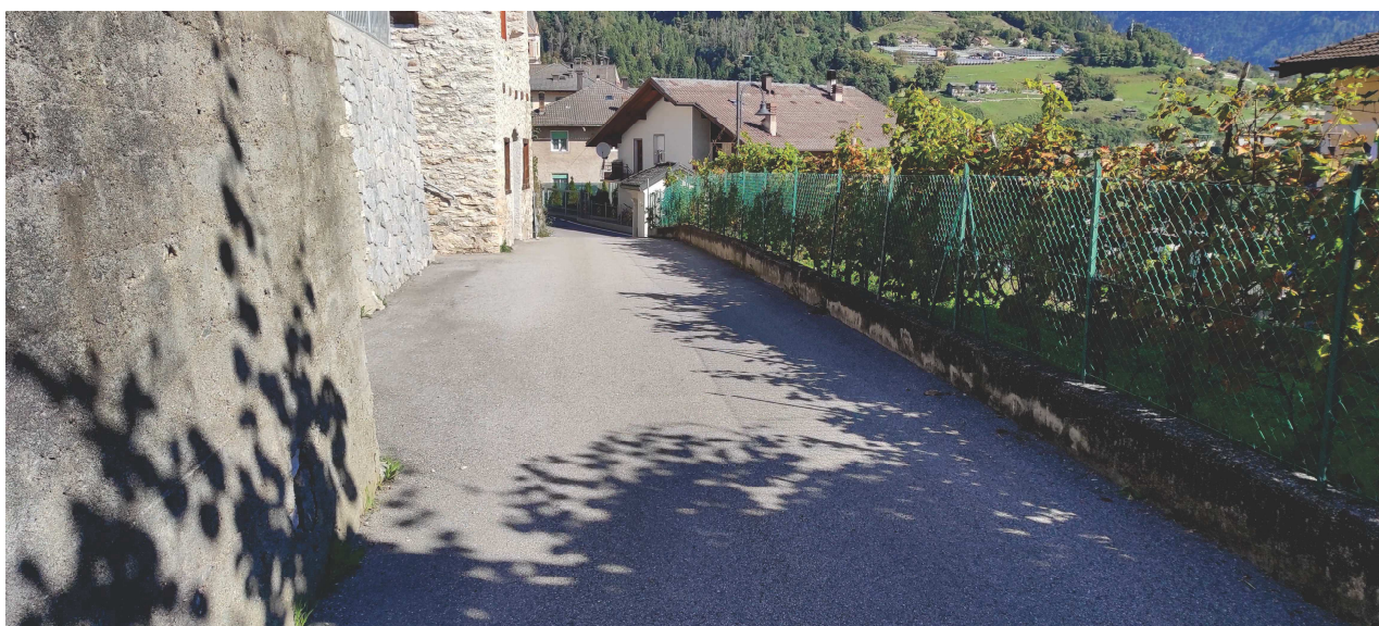
strada a monte