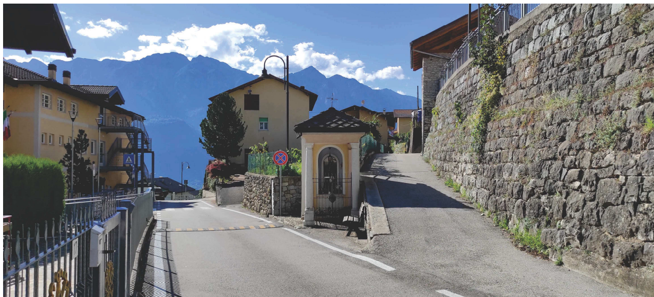
viste da nord scuola

– strada a valle - edicola - strada a monte