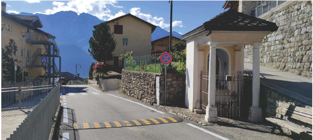
viste da nord scuola