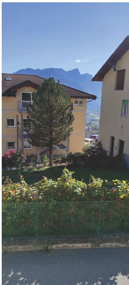
strada a monte