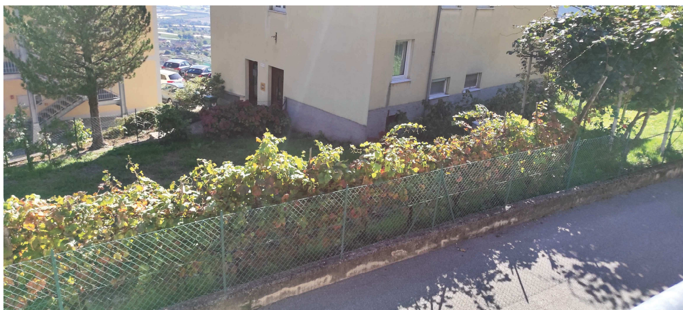
Vista da Ovest