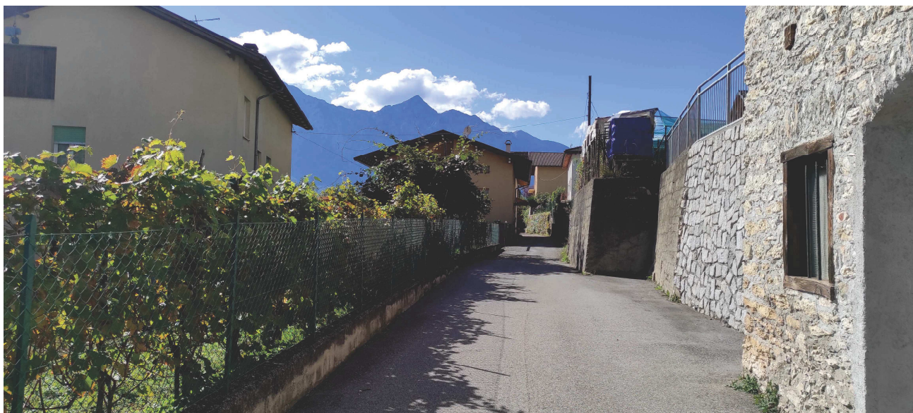
vista da nord - strada a monte

– strada a valle - edicola - strada a monte