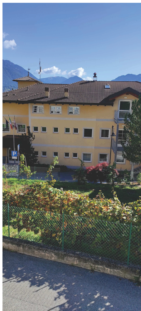
scuola a valle