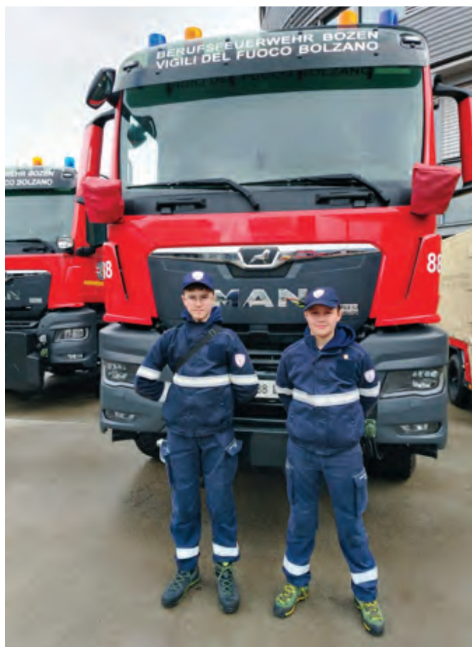
Vigili allievi in gita a Bolzano

Un grazie speciale va all'Amministrazione Comunale, alle ditte che ci hanno sostenuto con le sponsorizzazioni durante i nostri eventi e per i calendari e a tutti coloro che vorranno contribuire alla nostra attività. Grazie al loro aiuto, possiamo continuare a garantire un servizio alla comunità.