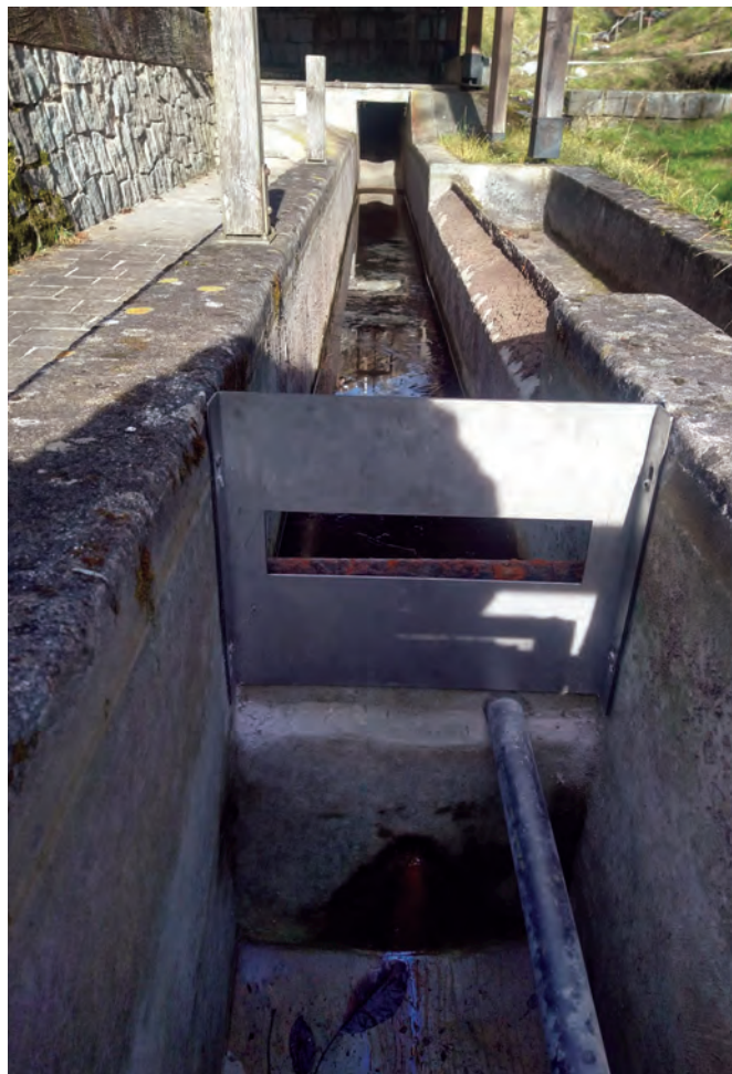
Lavori eseguiti in base alle nuove norme provinciali a seguito del rinnovo della concessione: garanzia deflusso minimo vitale al torrente e limitatore di portata.

Con l’approssimarsi delle prossime festività giungano a tutti i migliori auguri di un sereno Natale e felice anno nuovo.